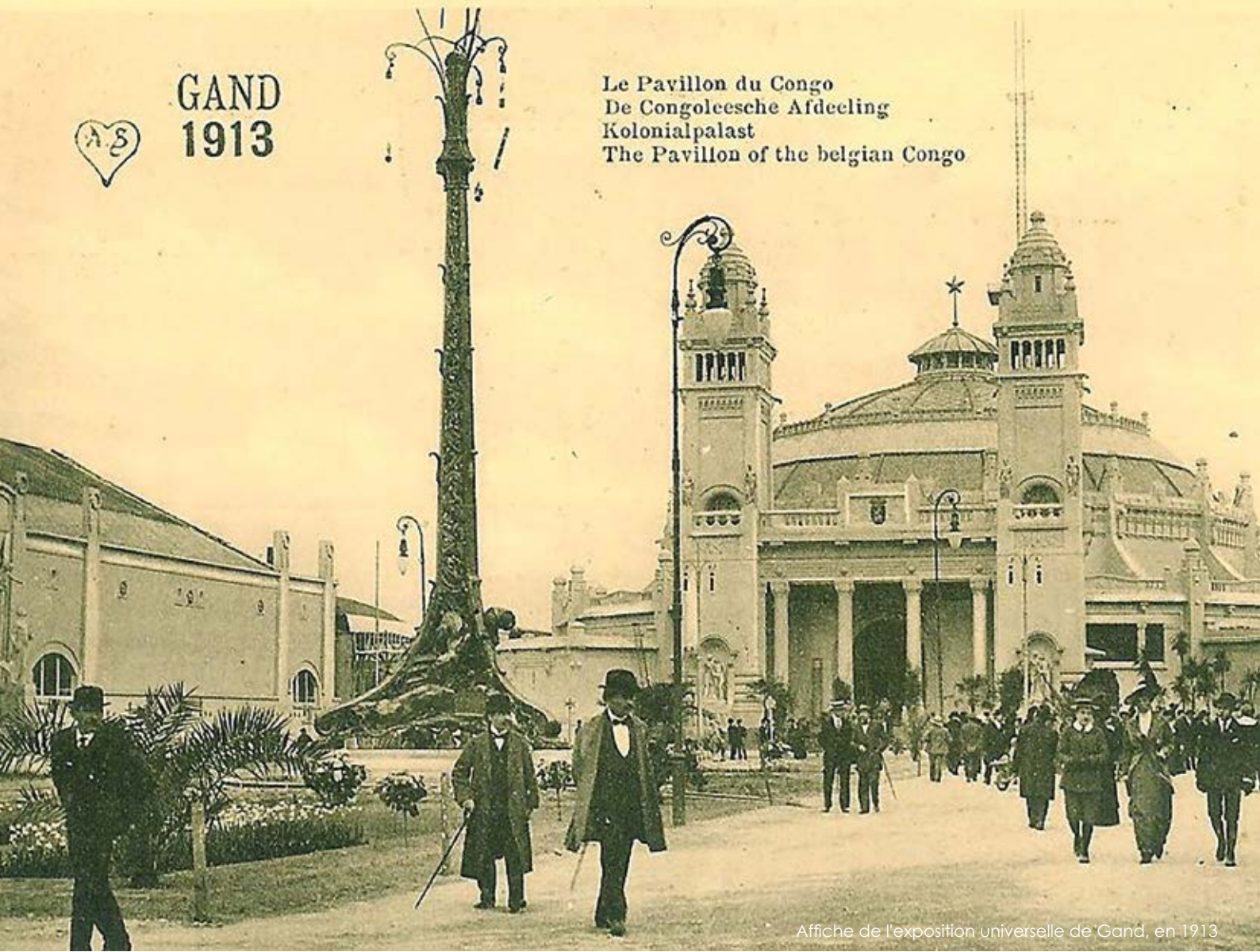
Affiche de l'exposition universelle de Gand, en 1913

Le Pavillon du Congo De Congoleesche Afdeeling Kolonialpalast The Pavillon of the Belgian Congo