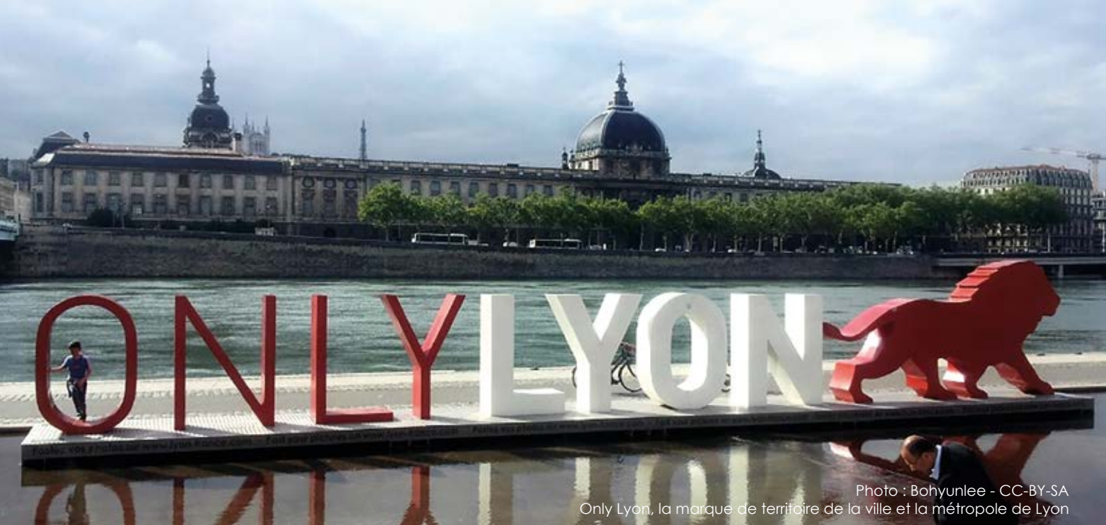
Only Lyon, la marque de territoire de la ville et la métropole de Lyon